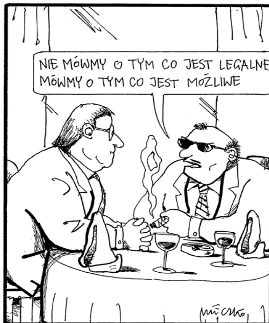
Rysunek Andrzej Mleczko

Zapoznaj się z rysunkiem Andrzeja Mleczki a następnie odpowiedz na zamieszczone poniżej pytania.